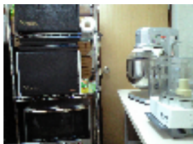
この場所で作ってます!

JUST JOY!は、栄町のRAFIKI本店3階の「食品製造部屋」で作られている「RAFIKIオリジナル手作りおやつ」なのです!