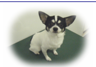
スムースチワワ 蓮見くん パワフルワンちゃん!